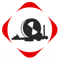
HOSE REEL IRRIGATORS